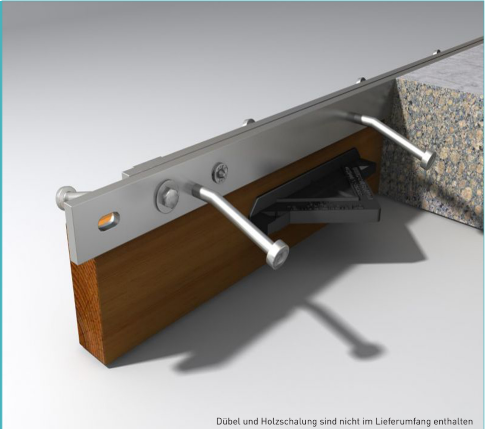
Dübel und Holzschalung sind nicht im Lieferumfang enthalten